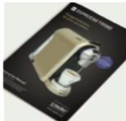
Инструкции за употреба

ВНИМАНИЕ: Може да намерите вода, останала в уреда. За да сме сигурни, че вашият уред работи перфектно, той е бил тестван с вода преди напускане на завода. Пазете опаковката за бъдещо транспортиране (например за ремонтни дейности и т.н.).