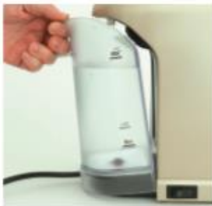
Резервоар за вода (J)